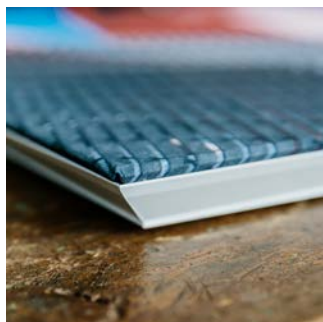
HYSSNY Facet (kuvassa Facet 20)

Kaikki akustiikkatuotteemme voidaan tehdä joko sisustuskankaalla tai kuvakankaalla. Vakiokokojen hinnat löytyvät hinnastostamme. Pyydä tarjous määrämittäisistä tuotteista: info@hyssny.fi