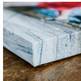
HYSSNY Shape (kuvassa suorakulmio)