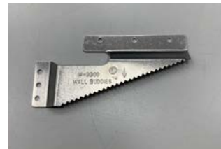
Shapen alumiiniset kiinnikelistat